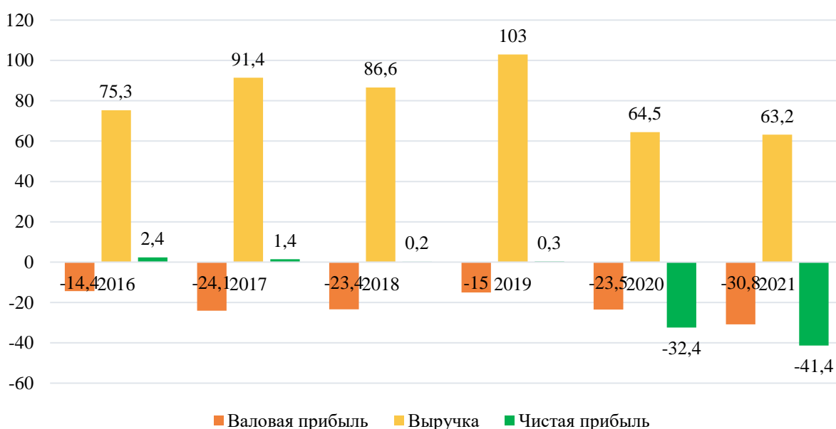
Рис. 1. Динамика показателей отчета о финансовых результатах компании ООО «Агрофирма «АрКо» за период 2016-2021 гг., в млн руб. [3]

Проведем анализ основных показателей компании ООО «Агрофирма «АрКо», которые отображены в графическом отчете о финансовых результатах. В частности, нам интересна динамика выручки, валовой прибыли и чистой прибыли (убытка) за период с 2016 по 2021 гг. (см. рис. 1).