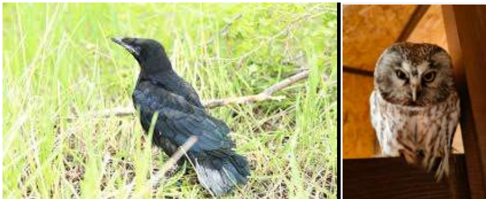
Рис. 2. Фото грача и сыча

Последними из пациентов центра, которые были выпущены на волю стали сыч и грач их подобрала местные жители в истощенном состоянии и передали сотруднику «GREENPOLE», птицы в процессе реабилитации дали положительный ответ на лечение и не показали признаков привыкания к человеку. Через месяц были выпущены на волю.