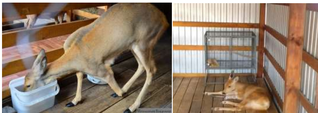
Рис. 1. Европейская косуля по кличке Уля

В первую очередь в центр попадают не способные к самостоятельной вольной жизни дикие звери и птицы, где им будет оказываться профессиональная помощь. Если животное после лечения и реабилитации, возможно, вернуть в среду обитания, то оно возвращается в природу, если же нет, то оно должно оставаться на доживание либо передаваться в другие специализированные центры. Так в центре поселилась европейская косуля по кличке Уля. Ампутирована передняя левая конечность. Имеется протез.