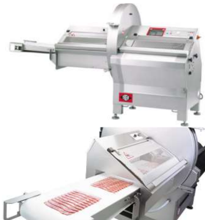
Рис. 3. Технологическое оборудование для нарезки мясных деликатесов

Сегодня такое оборудование внедряется на новых площадках многих мясоперерабатывающих предприятий. Главным преимуществом данного оборудования является универсальность, возможность индивидуальной настройки температуры, влажности, времени и интенсивности обработки продукции. При любых режимах работы остается неизменной равномерность распределения дыма, благодаря чему соблюдаются необходимые вкусовые параметры и качество продуктов.