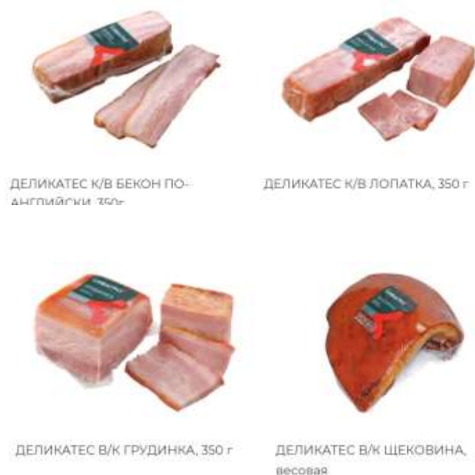
Рис. 1. Ассортимент мясных деликатесов АО комбинат пищевой «Хороший вкус»

Высокое качество производимых продуктов можно получить при наличии необходимого технологического оборудования, а именно – камер для копчения, созревания и вялки, являющихся незаменимыми в приготовлении продукции. Различают термокамеры коптильные универсальные, термодымовые камеры, созревания и вялки, интенсивного охлаждения.