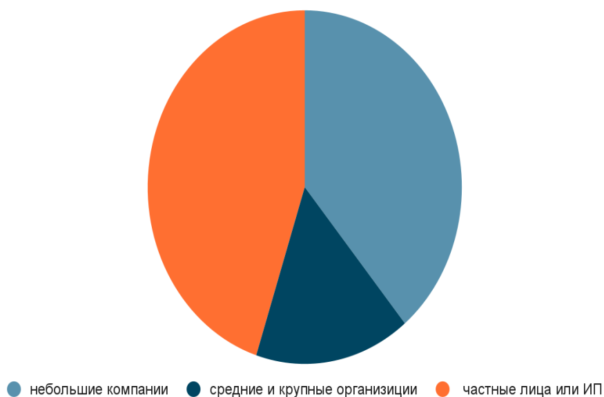
Рис. 1. Процентное соотношение нанимателей на бирже фриланса

Ниже мы можем увидеть соотношение компаний, использующих услуги фрилансеров: