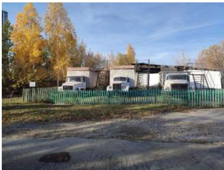
Рис. 5. Кинодром «обыск транспорта»

Для каждой собаки требуется индивидуальный подход, поэтому необходимо учитывать все индивидуальные факторы (возраст, характер, пол, породу) собаки при дрессировке. Так же не стоит забывать о технике безопасности.