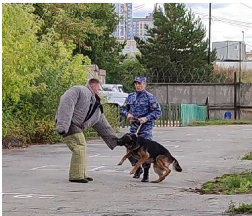
Рис. 2. Выработка злости и недоверия к чужим

Агрессию вырабатывают на специальных тренировочных рукавах – фигурант дразнит животное, ударяя по земле перед собакой прутами, делает махи рукавом или же тряпкой, издает громкие звуки, затем начинает убегать. Основная задача в этом случае – спровоцировать собаку на хватку и преследование. После того как собака схватила фигуранта за рукав, он подтягивает рукав к себе, как бы отнимая его у собаки. Если собака держит его крепко – стоит бросить рукав, но как только животное ослабит хватку, фигурант переключает внимание собаки на иной предмет. По команде кинолога - специалиста фигурант (статист) уходит в укрытие, так, чтобы собака его не видела, а само упражнение завершается выгулом животного [3].