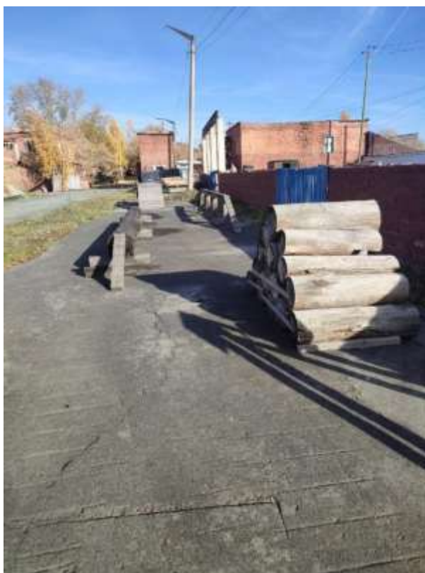
Рис. 4. Кинодром «полоса препятствий»