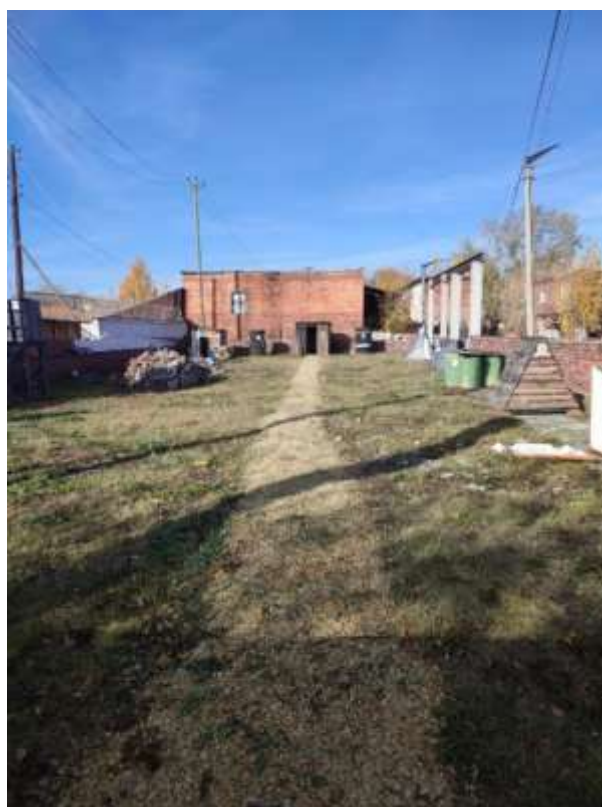
Рис. 3. Кинодром «обыск местности»

Сами занятия по дрессировке служебных собак в целях их подготовки к практическому применению в оперативно-служебной деятельности проводится на кинодромах (рис. 3).