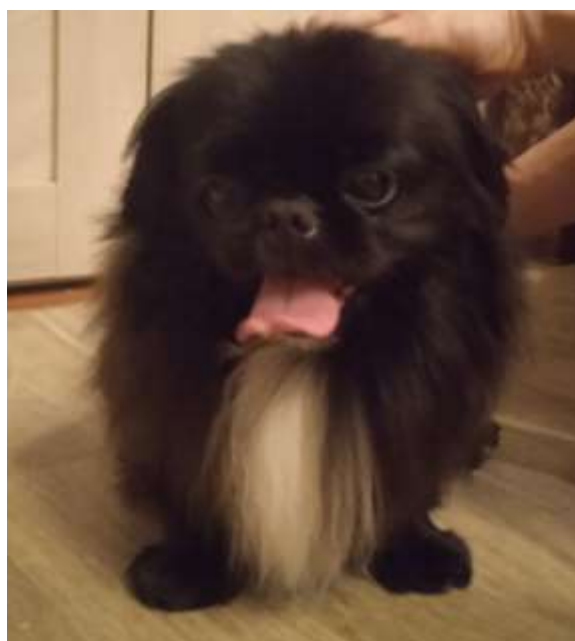
Рис. 5. Фото оцениваемой собаки спереди. Передние конечности

Шерсть достаточно длинная, особенно в области шеи, формируя «гриву льва». Также она имеет приличную длину на хвосте, бедрах, ушах. Но здесь есть одна особенность – такая гордость не должна мешать телодвижениям. Мы свою собаку подстригаем. Окрас может быть абсолютно любым, а его выбор только дело вкуса. Хома в возрасте одного месяца был угольно-черный с белым пятном на груди. Сейчас же появился густой серый подшерсток. Стоит отметить, что его окрас делает Хому неуловимым для фотоаппаратов и камер, потому что чаще всего выглядит как большое темное пятно на пленке[2].