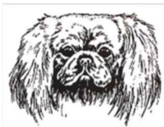
Рис. 2. Стандарт головы собаки породы пекинес