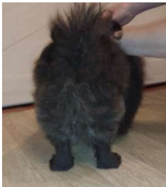
Рис. 4. Фото оцениваемой собаки сзади. Задние конечности