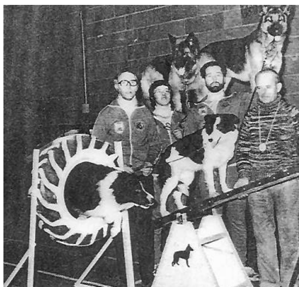
Рис. 2. победители первого состязания по аджилити на Крафтс 1978 года

В 1978 году шоу Крафтс (Crufts) мгновенно заинтересовало владельцев собак быстротой, сложностью также ловкостью, продемонстрированными животными. Зрители хотели наблюдать больше и желали, чтобы их собственные питомцы имели возможность принимать участие в нем. Представление стало до такой степени востребовано, что начало переходить в местные, позднее национальные, и в результате, во международные соревнования со стандартизированным оборудованием. 1979 году ряд английских тренировочных кинологических клубов стали представлять обучение собак новому виду спорта - аджилити, так в декабре этого же года первое соревнование «Ставки на проворство» (Betting on agility) состоялся на Международном конном шоу в Олимпии в Лондоне [1].