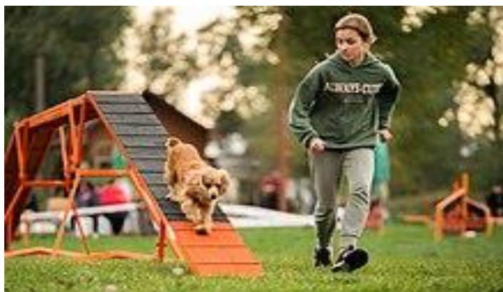
Рис. 1. хозяйка направляет собаку по трассе