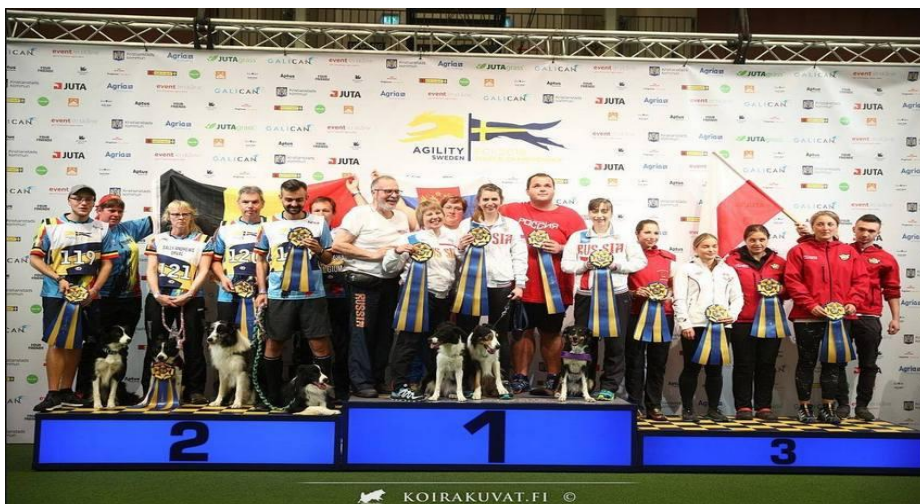
Рис. 3. Российская сборная, занявшая 1 место на Чемпионате МКФ 2018 по аджилити [3]

В Свердловской области существует около 10 организаций, многие из которых находятся в Екатеринбурге, занимающиеся тренировками по аджилити.