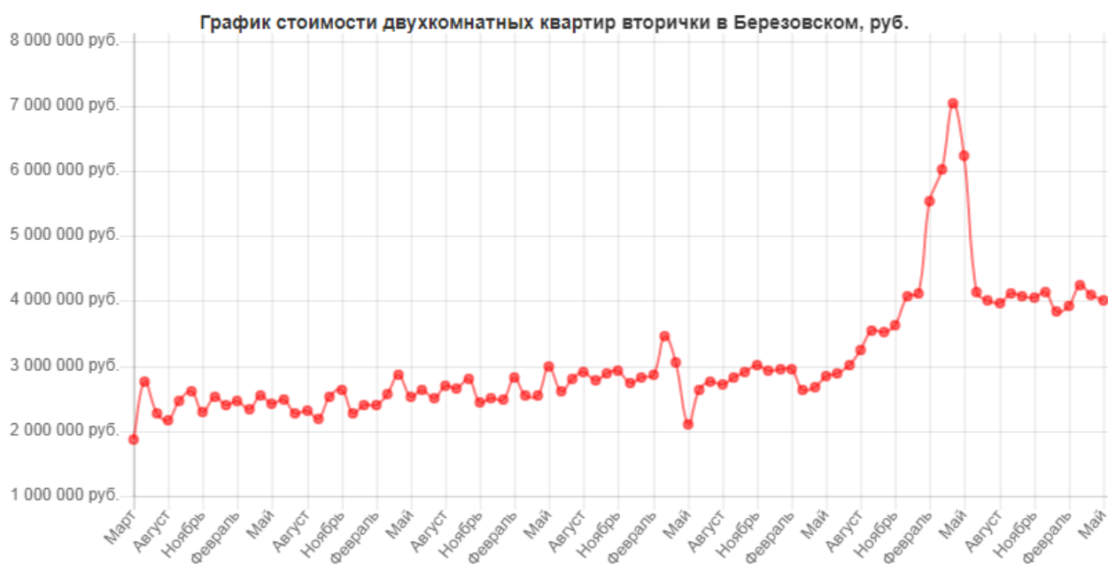
Рис. 2. График стоимости двухкомнатных квартир города Березовский Свердловской области, 2016-2023 гг.

На рисунке 2 представлена динамика изменения стоимости двухкомнатных квартир города Березовский за несколько лет. Максимальная стоимость составила более 7 млн руб.