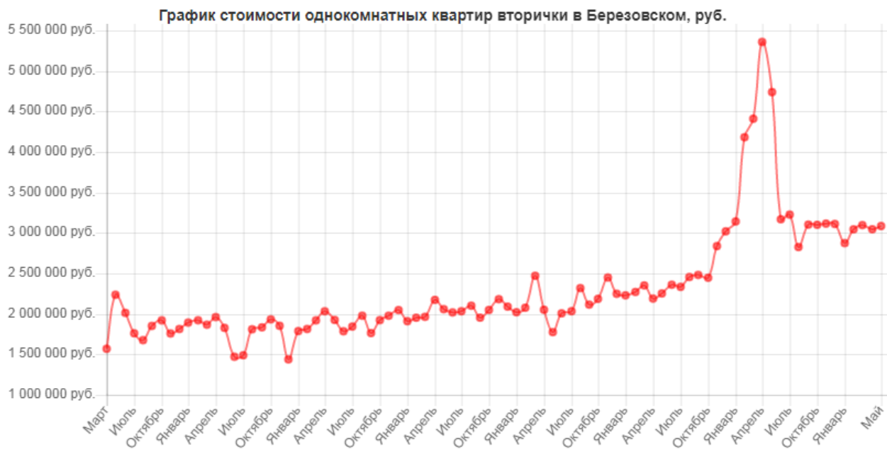
Рис. 1. График стоимости однокомнатных квартир города Березовский Свердловской области, 2016-2023 гг.

На рисунке 2 представлена динамика изменения стоимости двухкомнатных квартир города Березовский за несколько лет. Максимальная стоимость составила более 7 млн руб.