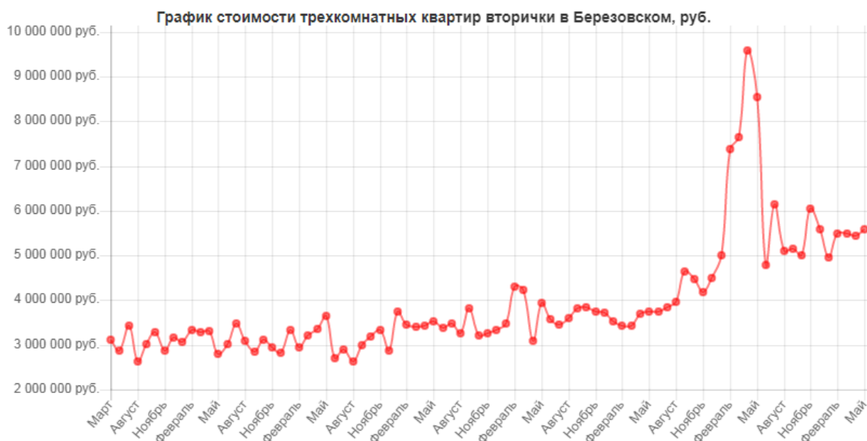
Рис. 3. График стоимости трехкомнатных квартир города Березовский Свердловской области, 2016-2023 гг.

Как мы видим из представленных графиков стоимость на квартиры начала повышаться в начале 2022 года, своего пика цены достигли летом 2022 года.