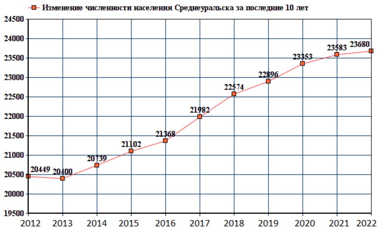
Рис. 1. График численности населения города Среднеуральск

Город постоянно строится и развивается, появляется все больше и больше различных предприятий, а значит и рабочих мест. Именно поэтому численность населения с каждым годом только увеличивается. Данные, полученные от службы государственной статистики являются подтверждением этому. Ниже, на рисунке 1 представлен график численности населения в городе Среднеуральск за последние 10 лет.