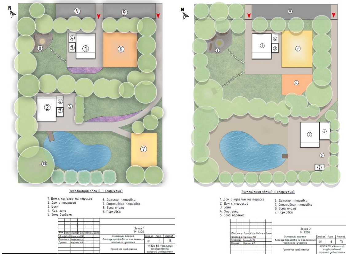
Рис. 3. Эскизные варианты